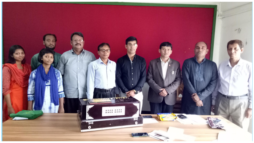
चारौन साँस्कृतिक समूहसँग ढाका, बंगलादेश (नोभेम्बर, २०१७)