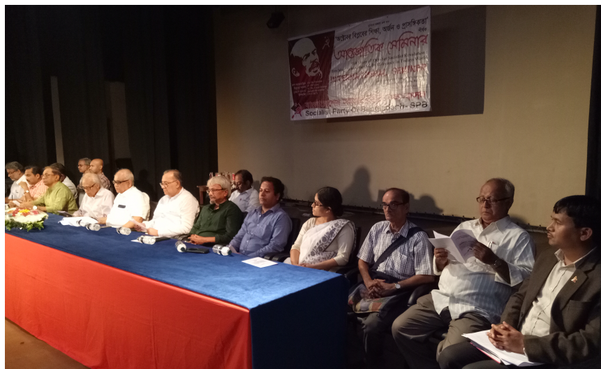
अन्तर्राष्ट्रिय सेमिनारमा सहभागी विभिन्न देशका प्रतिनिधिहरू, ढाका (नोभेम्बर, २०१७)