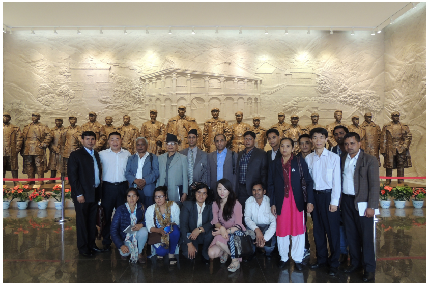
चुई बैठक स्थल क्वीचो प्रान्त (मे, २०१६), चीन