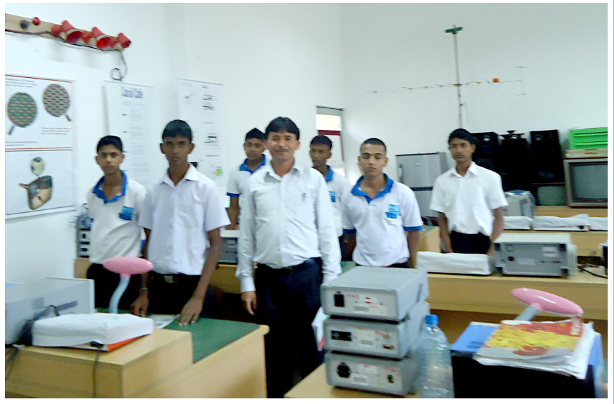
भोकेसनल ट्रेनिङ इन्स्टिट्यूट, नियागामा श्रीलंकाका विद्यार्थीहरूसँग (जुन, २०१२)