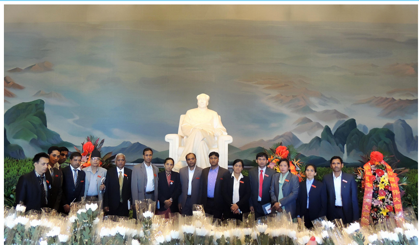
माओत्सेतुङ स्मृति भवन बेइजिङ, चीन (मे, २०१६)