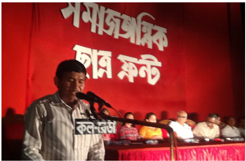
समाजवादी छात्र फ्रन्टको चौथो सम्मेलनमा शुभकामना दिदै (मार्च, २०१६), ढाका, बंगलादेश