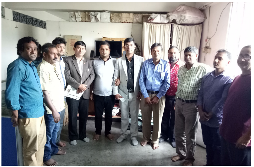
समाजवादी पार्टी अफ बंगलादेशको कार्यालय, ढाकामा पार्टी कार्यकर्ताहरूसँग (नोभेम्बर, २०१७)