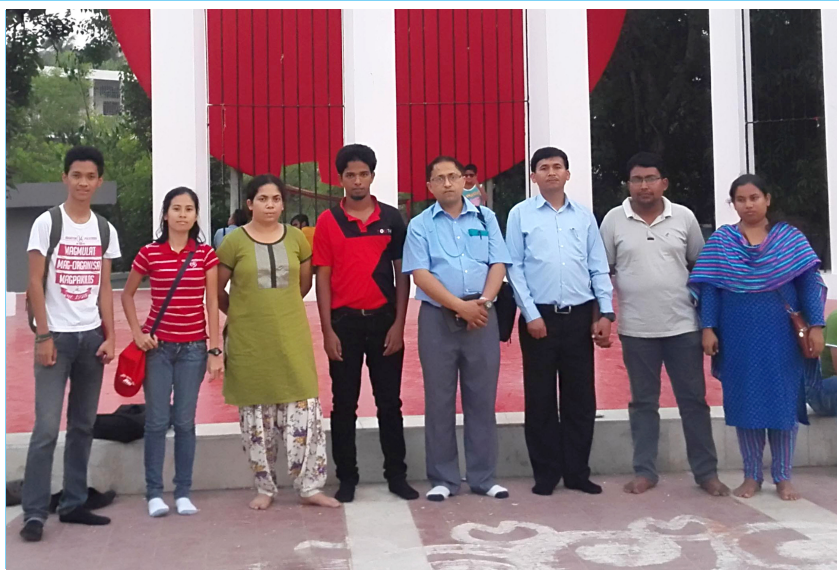
भाषा आन्दोलनका सहिदहरूको स्मृति स्थलमा विभिन्न देशका प्रतिनिधिहरूसँग (मार्च, २०१६), ढाका