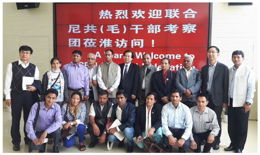
पार्टी स्कूल विभाग हवो याङ (मे, २०१६), चीन