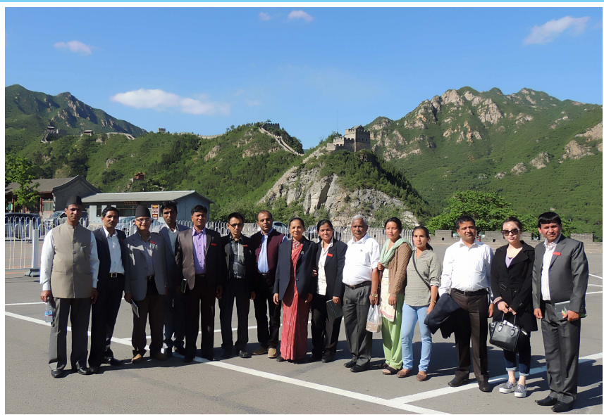
ग्रेटवाल, चीन (मे, २०१६)