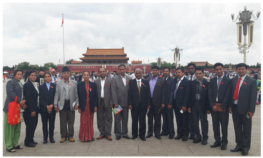
तियनमेन स्क्वायर बेइजिङ (मे, २०१६), चीन